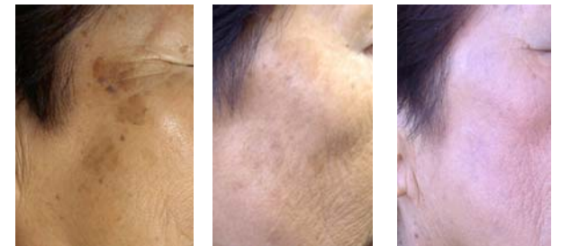
治療前(化粧なし) フォトフェイシャル3回後(化粧なし) フォトフェイシャル4回後(化粧あり)

とれないものとあきらめていた頬のシミがほぼ完全に消えました。肌につやもはりもでてきて、友人、家族も驚くばかりです。同じように肌の悩みのある方の参考になればと写真の公開を快諾してくださいました。